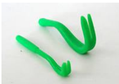
Рисунок 8. Выкручиватель для клещей.

необходимо сжечь. А за щенком (собакой) понаблюдать более внимательно. Клещей можно выкручивать пальцами, а можно купить в Зоомагазине "выкручиватель", который по виду напоминает обычный гвоздодер. Стоит он недорого, но пользоваться им очень удобно.