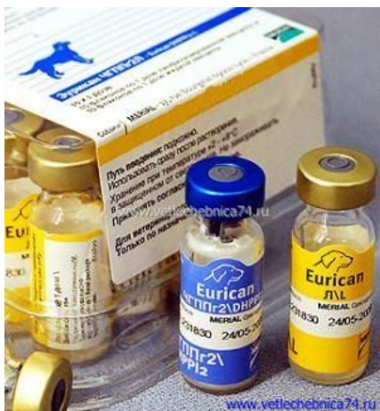
Рисунок 9. Вакцина Эурикан.

Первая прививка делается в возрасте 8-9 недель «Эурикан» без бешенства .