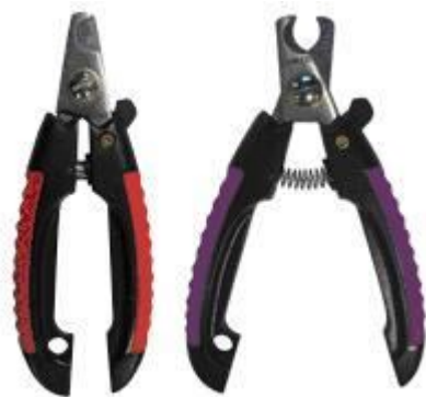
Рисунок 5. Пример когтерезок.

Правильный уход за Вашим питомцем – залог его долгой, здоровой жизни и прекрасного внешнего вида.