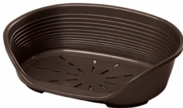
Рисунок 1. Лежак для собаки.

Место (лежак) лучше покупать из пластмассы (рис. 1). Его легко мыть и поддерживать в чистоте. (Тряпичные лежаки и плетеные – будут особо интересны малышу, вернее, его зубам,