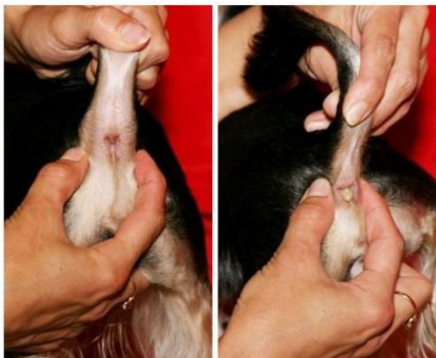
Рисунок 7. Чистка анальных желез.

Анальные железы - производные потовых и сальных желёз у млекопитающих. Открываются в полость задней кишки или рядом с анусом. Выделяют густую, пахучую жидкость. Используются животными для узнавания друг друга, привлечения партнеров, отпугивания врагов, а также для мечения занятой территории.