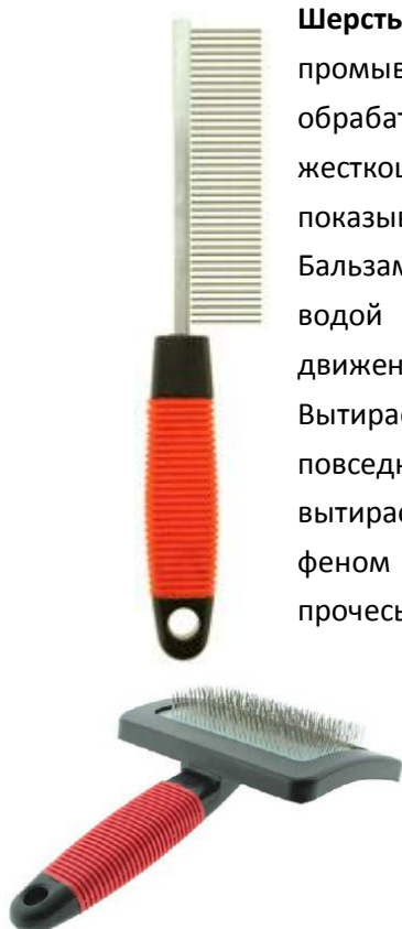
Рисунок 6. Двусторонняя расческа и пуходерка для шерсти собаки.

СУХУЮ и МОКРУЮ шерсть расчесывать НЕЛЬЗЯ!